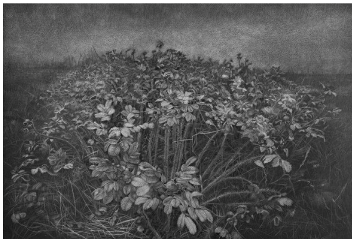
Béla Remák: Dánská melancholie (2015), kresba