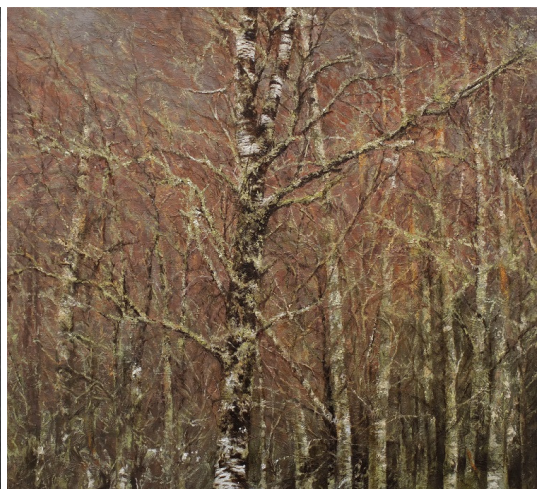
V.R.Molatová: Severský lišejník (2016), olej